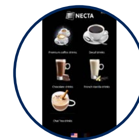
CATÉGORIES PERSONNALISABLES POUR UNE NAVIGATION SIMPLIFIÉE