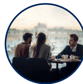
UNE TOUCHE PERSONNELLE À VOTRE PAUSE-CAFÉ