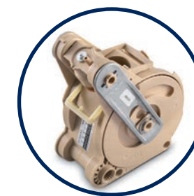
INFUSION DE TYPE ESPRESSO AUTHENTIQUE