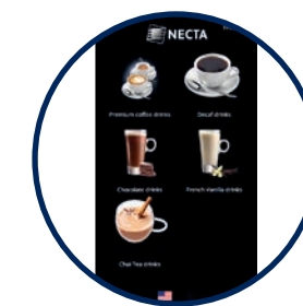
CATÉGORIES PERSONNALISABLES POUR UNE NAVIGATION SIMPLIFIÉE