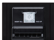
Accepteur de billets