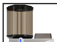
Contenant à grains allongé