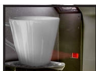
Détecteur de verre