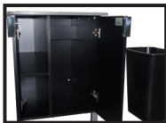
Bahuts de bois