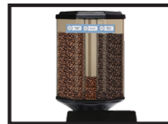
Contenant à grains allongé