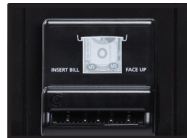
Accepteur de billets